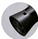
Cestello tendifiltro con galleggiante