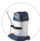
Sistema basculante: svuotamento fusto facilitato