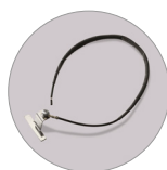
Kit antistatico (IK)