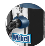
Attacco tubo rapido